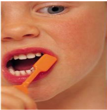
Cepillarse (los dientes, el pelo)