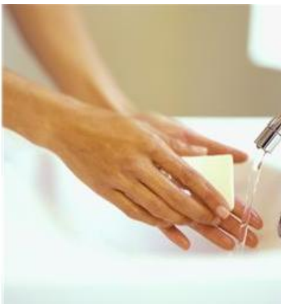
Lavarse (las manos)